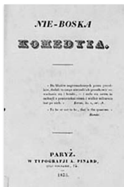
Karta tytułowa pierwszego wydania Nie-Boskiej Komedii