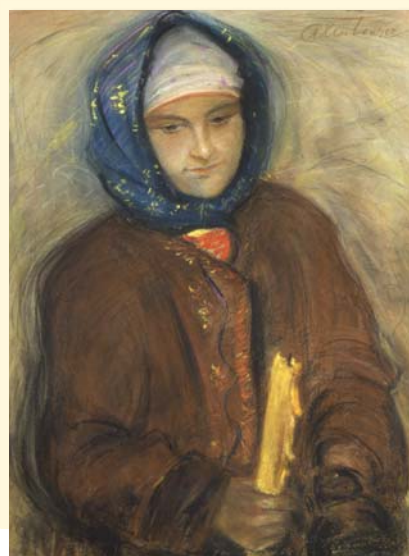
Teodor Axentowicz, Na Gromniczną , niedatowany; pastel, karton, 51x67 cm

2 maja br., w czasie organizowanej w naszym Muzeum cyklicznej imprezy „Imieniny Zygmunta”, odbędzie się wernisaż wystawy „Chciałem odbudować polską duszę. W hołdzie Władysławowi Reymontowi, pierwszemu Nobliście Niepodległej Polski”.