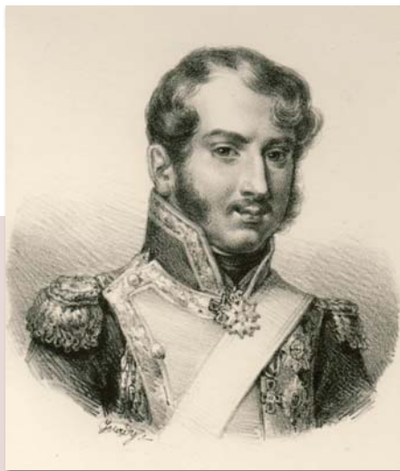
Generał Wincenty Krasiński

Celem konferencji jest zapoznanie z aktualnym stanem badań nad tą postacią, jej życiem i działalnością. Mamy tu na myśli