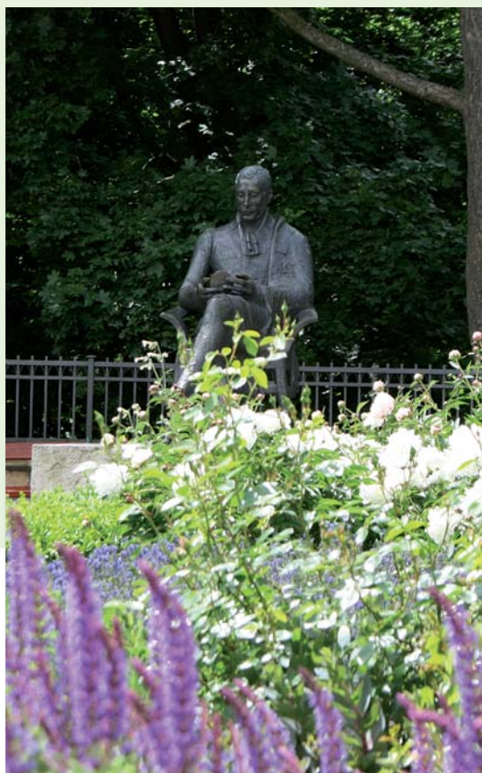
Pomnik Zygmunta Krasieńskiego