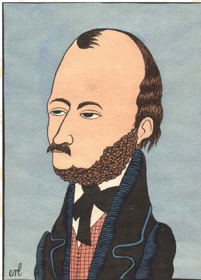
Karykatura Zygmunta Krasińskiego. Rysunek Eryka Lipińskiego, lata 80. XX w., ze zbiorów Muzeum Karykatury im. Eryka Lipińskiego w Warszawie