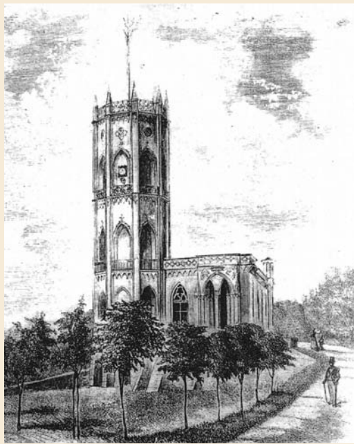
Zamek w Opinogórze, reprodukcja wg „Tygodnik Ilustrowany” nr 100 z 1877 r.

do niego mały staw, po którym można pływać na dwóch ładnych, zielonych łódkach przycumowanych do brzegu wśród trzciny i wysokich traw – opodal znajduje się folwark, gdzie wieczorem można zobaczyć powracające (z pastwiska) szwajcarskie krowy z dzwonekami u szyi; ponadto w po-