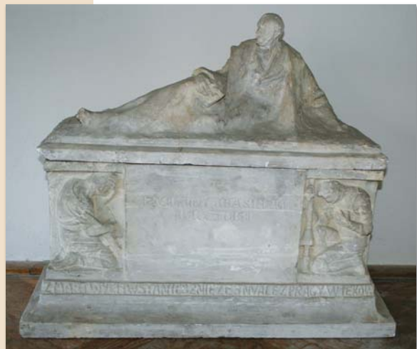
Model nagrobka w skali 1:3

W ostatnich latach Muzeum Romantyzmu w Opinogórze powróciło do pomysłu wystawienia nagrobka Zygmunta Krasińskiego w podziemiach kościoła opinogór-