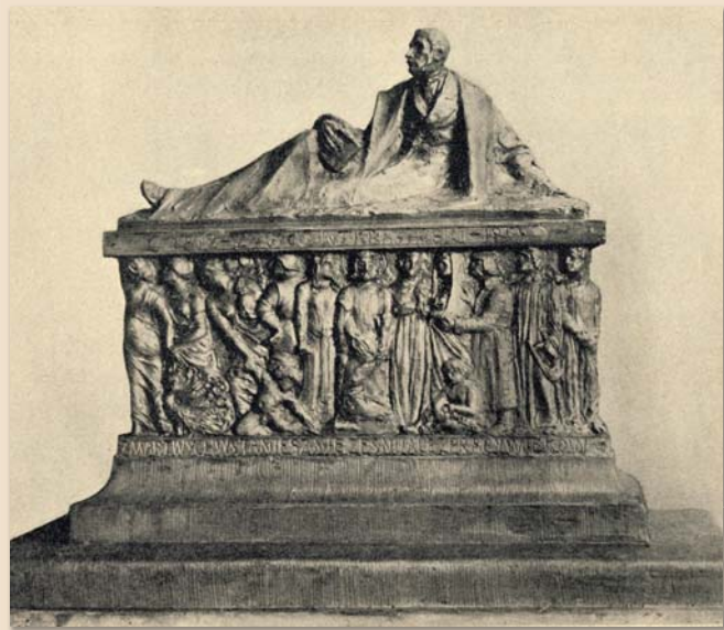
Projekt nagrobka z 1907 roku

W 1997 r. wobec zbliżającej się 140. rocznicy śmierci poety Towarzystwo Miłośników Opinogóry, Towarzystwo Miłośników Ziemi Ciechanowskiej i Mazowieckie Towarzystwo Kultury, wystąpiły z projektem modernizacji podziemi grobo-