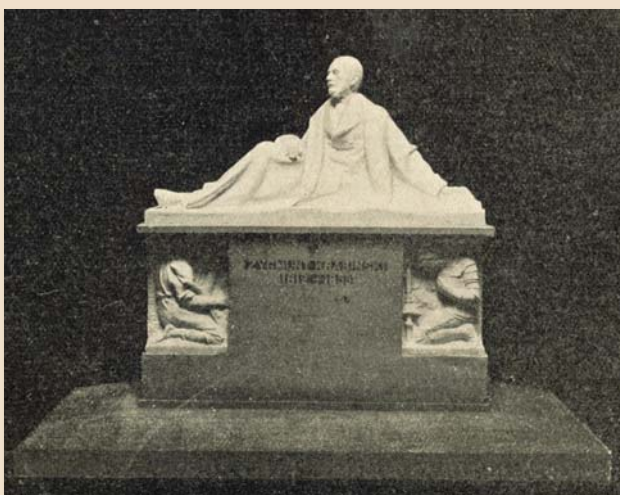
Projekt nagrobka (Tygodnik Ilustrowany 1925) – ostateczna wersja