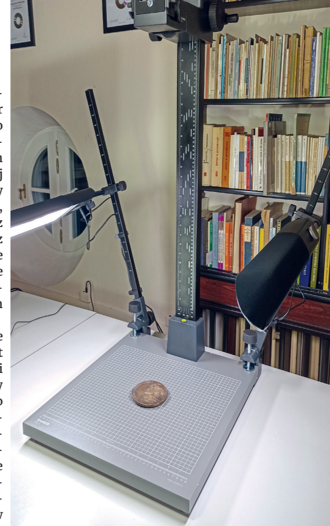
Kolumna reprodukcyjna z zestawem lamp