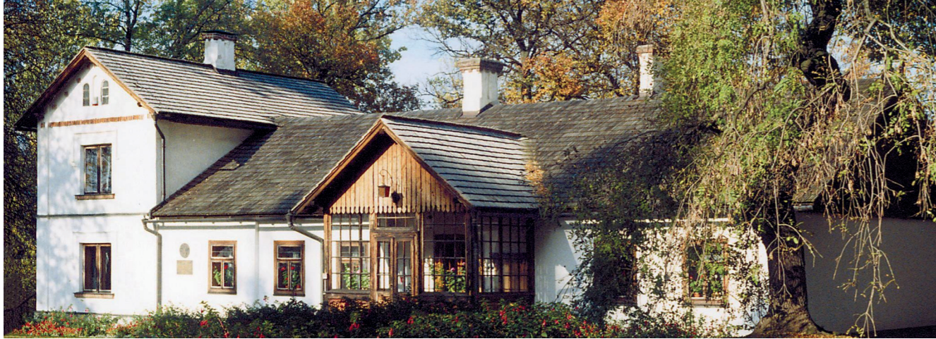
Dworek Marii Konopnickiej w Żarnowcu od strony południowej