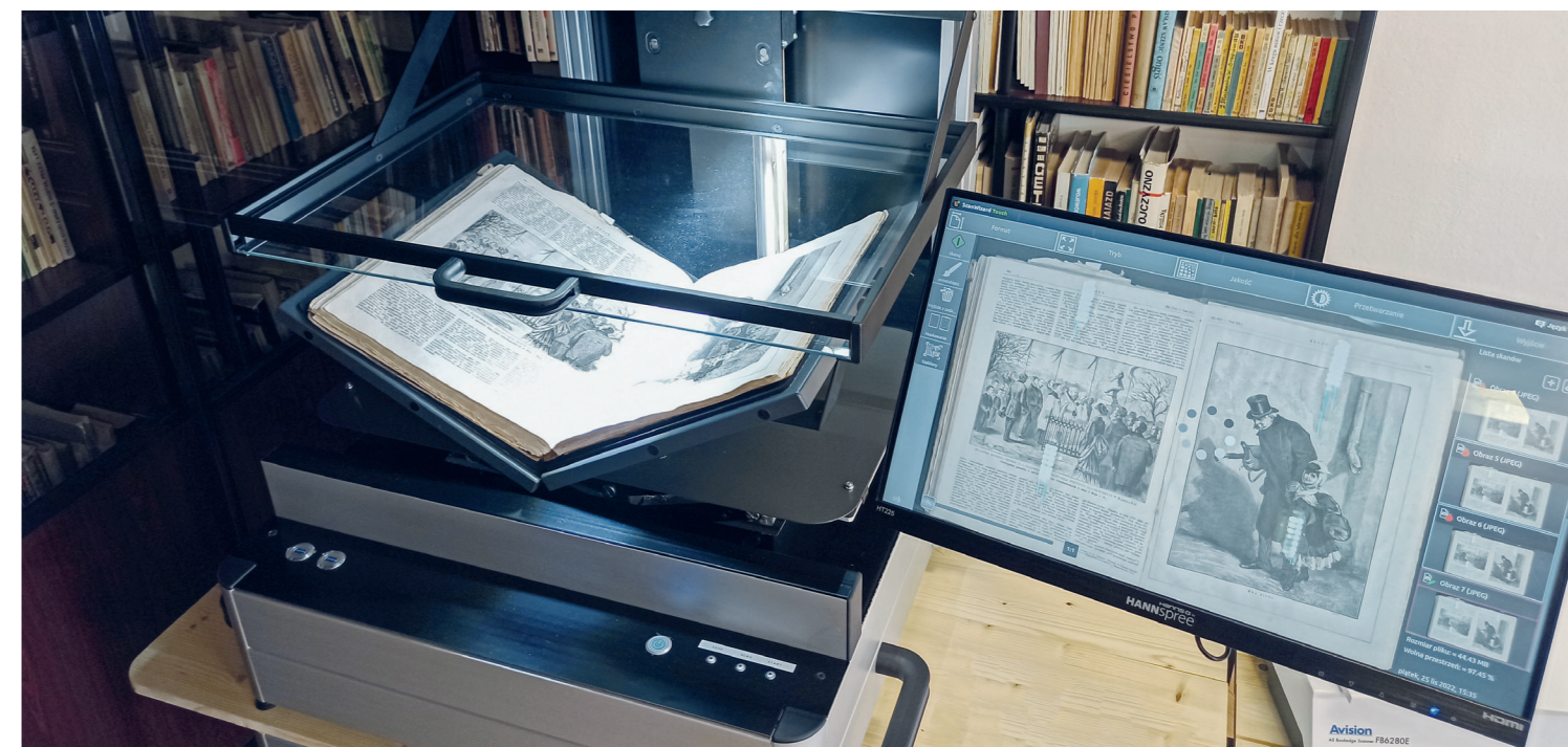
Skaner dziełowy formatu A2 do masowej digitalizacji wielkoformatowych materiałów bibliotecznych i archiwalnych