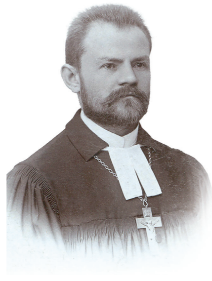
Ks. Juliusz Bursche.