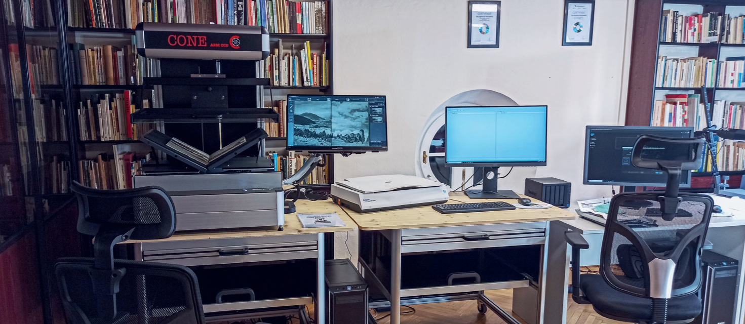
Pracownia digitalizacji wyposażona jest w komputery ze specjalistycznym oprogramowaniem do obsługi skanerów oraz obróbki graficznej fotografii obiektów muzealnych