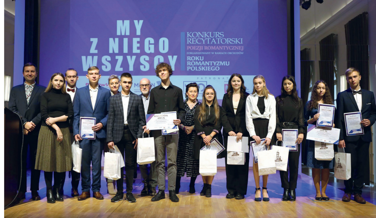
Pamiątkowa fotografia uczestników konkursu